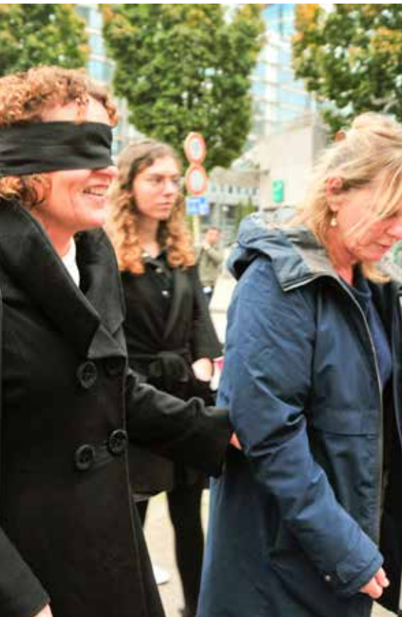
Minister Peeters op stap

Op het programma stonden show-down, torbal, dans en jiu-jitsu. Dit alles onder begeleiding van professionele lesgevers en extra studenten als begeleiding. Aangezien de opkomst gering was zijn onze mensen dik in de watten gelegd. Ze hebben genoten van de fijne activiteiten en konden proeven van nieuwe sporten. Met een leuk G-sporttasje als aandenken zijn we allemaal moe en voldaan huiswaarts gekeerd!