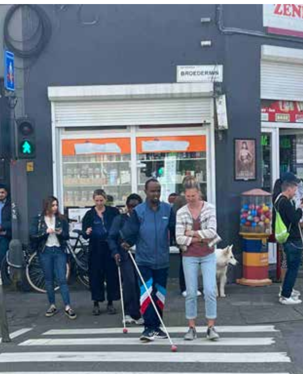
Demodag OKO app

19 april stond in het teken van de OKO-app die door Ayes op de markt werd gebracht. De mobiliteitstrainers van Visuele revalidatie waren en zijn betrokken bij de mogelijkheden van deze app, die de verkeerslichten uitleest op een kruispunt zodat een veilige verplaatsing beter mogelijk is. De medewerkers van Ayes gingen samen met onze gebruikers en mobiliteitstrainers op pad om de app toe te lichten en in de praktijk de mogelijkheden uit te testen.