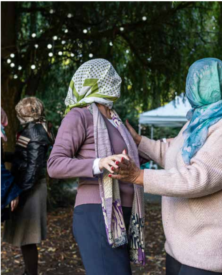
Repetitie ervarings theater