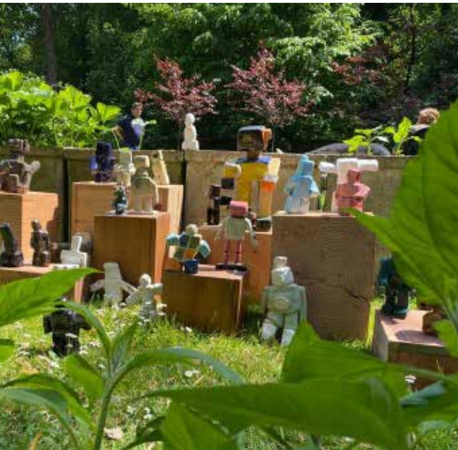
Tentoonstelling AC opendeurdag