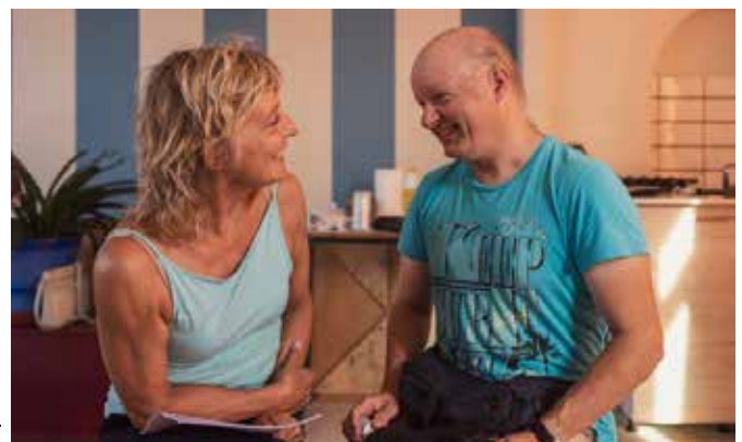
Repetitie in buurthuis UNIK