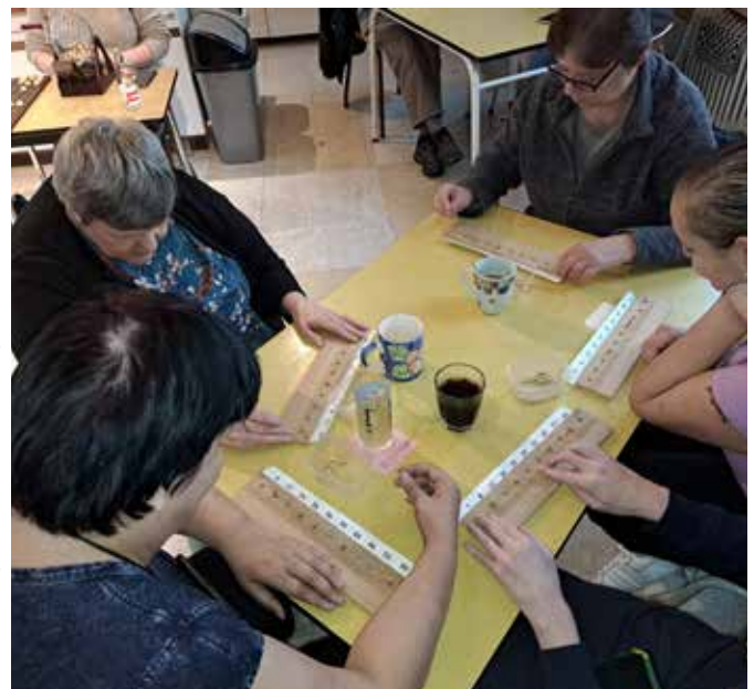
Inclusieve bingo in buurthuis UNIK (Zorgzame Buurten)