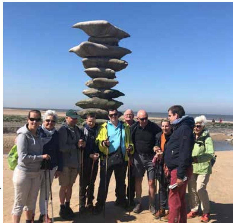
Nordic Walking in Oostende