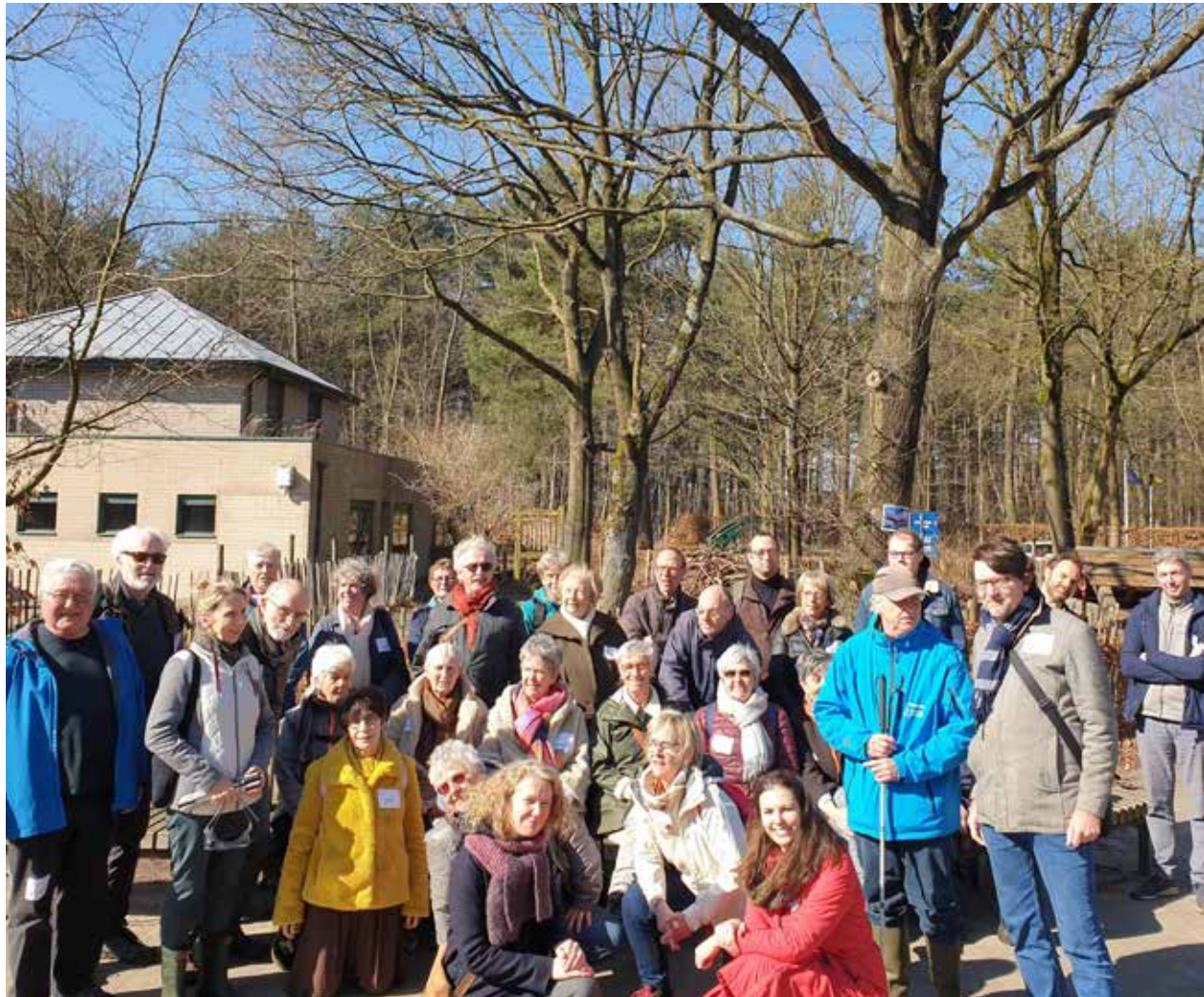
Vrijwilligersdag Kalmthoutse Heide