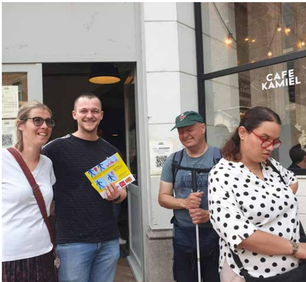
Obstakelvrij op pad