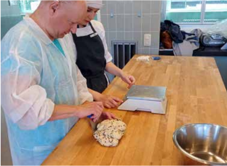
Bakken bij PIVA