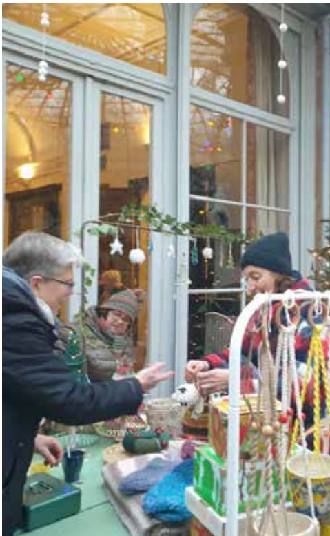
De buurt wintert