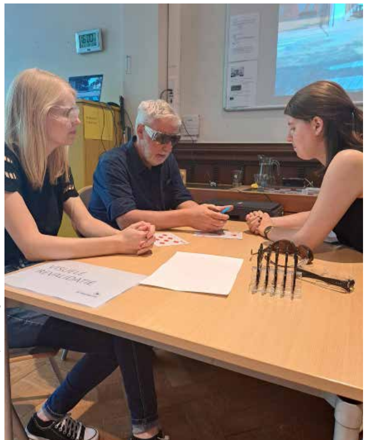
Demonstratie VR-bril Opendeurdag