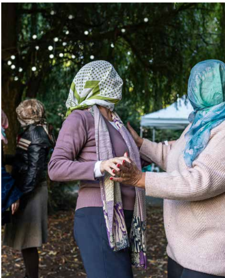
Repetitie ervarings theater